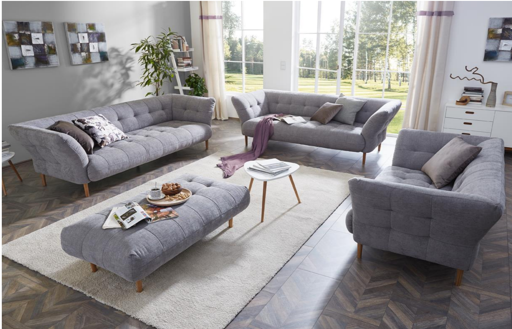
3-Sitzer / 2,5-Sitzer / Loveseat im Bezug Yelda light grey - Kissen gegen Aufpreis